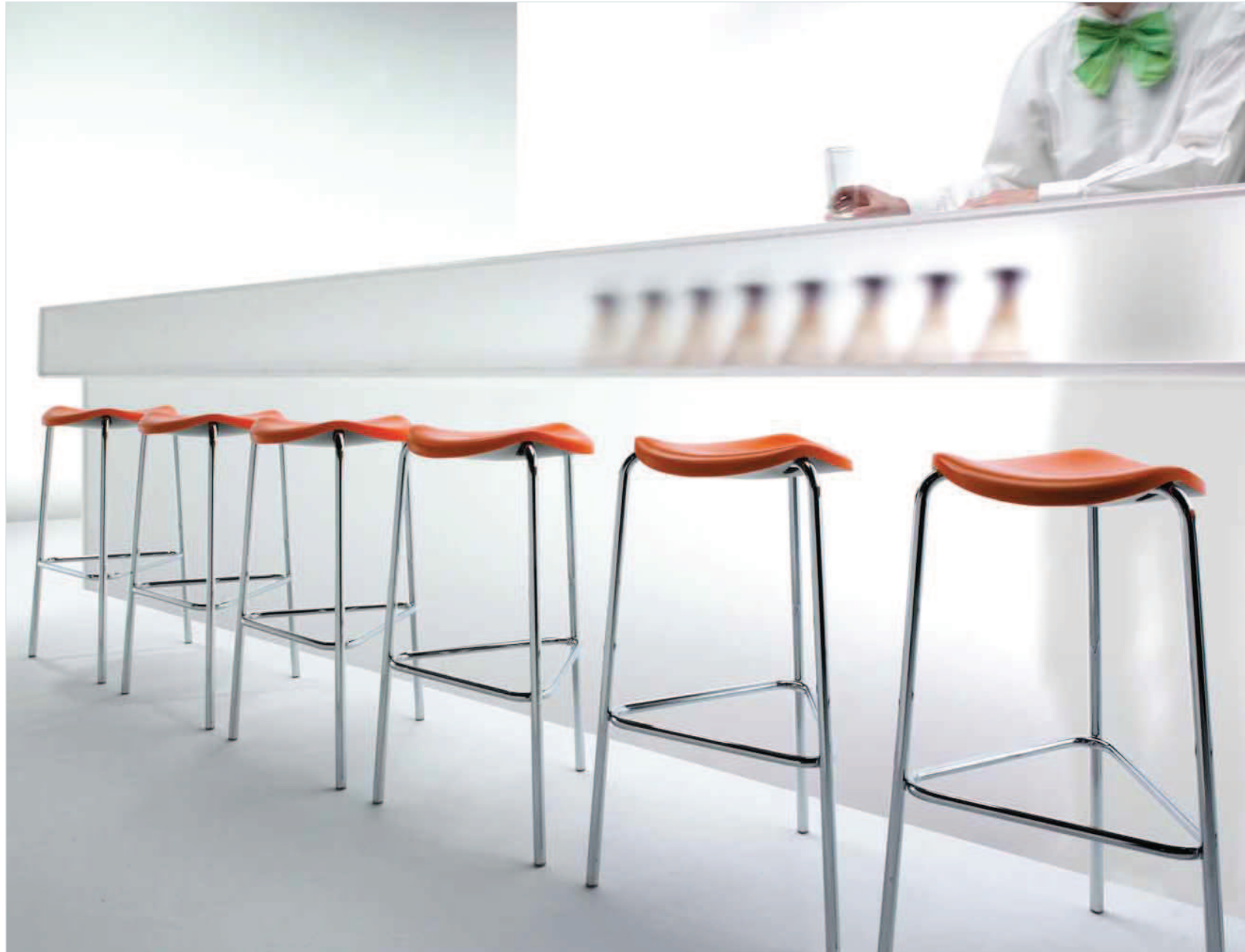
2262. WELL sgabello alto bar stool