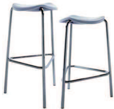
2261. WELL sgabello medio kitchen stool