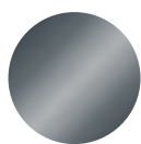
Gris anthracite RAL 7016