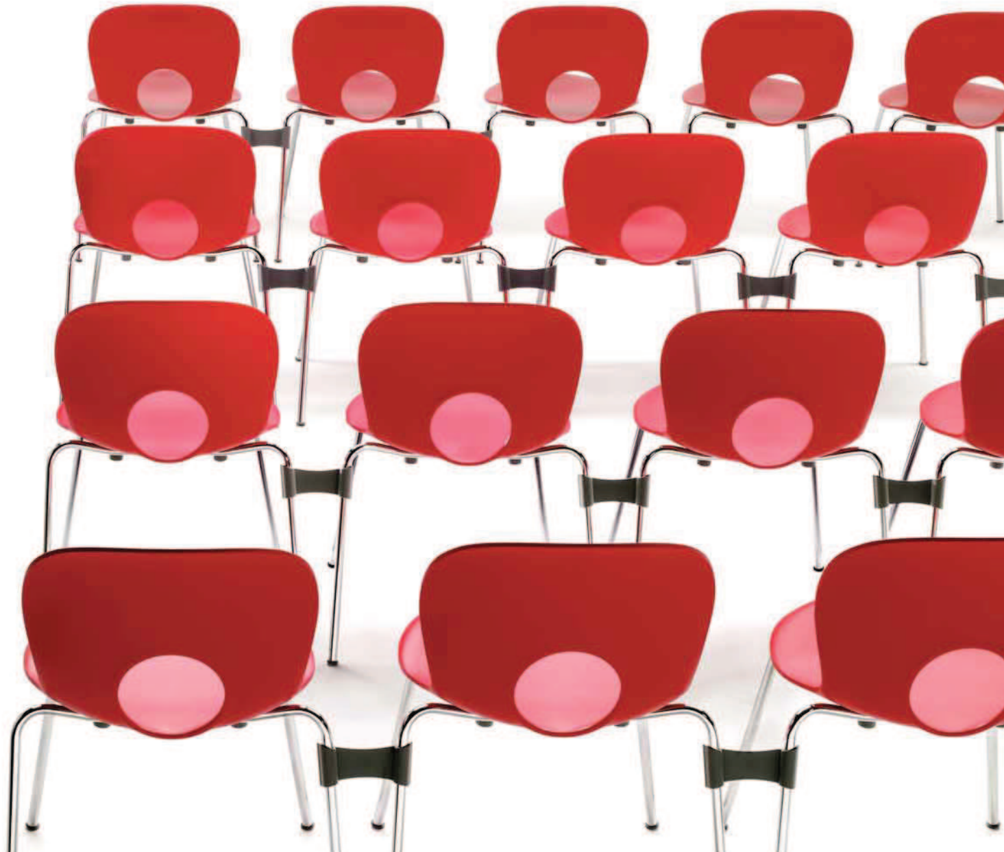
114. giunto di collegamento per OLIVIA e ALEXA connecting joint for OLIVIA and ALEXA