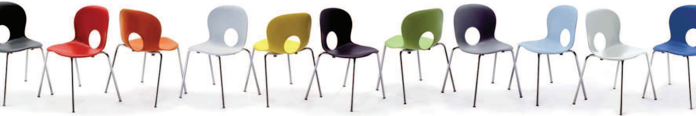
2500. OLIVIA sedia impilabile stackable chair