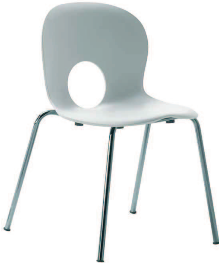
2500. OLIVIA sedia impilabile stackable chair

La silla Olivia es el prototipo de una articulada colección de asientos. Se distingue por su línea suave y por su orificio redondo en el respaldo: un círculo perfecto, un verdadero icono distintivo. El asiento está realizado en polipropileno con una gama de 11 colores, la estructura es en acero cromado.