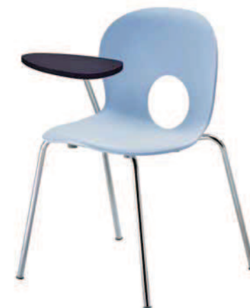
2509. OLIVIA sedia con tavoletta ribaltabile chair with folding tablet

Olivia está disponible también en la versión con mesita abatible derecha o izquierda. La mesita-escritorio está realizada en polímero técnico negro y está dotada de junta antipánico.