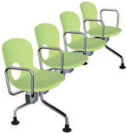
OLIVIA sedute e tavolini su barra seats and tables on ganging rail

La bancada en acero acabado aluminio se puede componer libremente con asientos y mesitas, de 2 a 5. Los asientos, disponibles en 11 colores, están dotados de brazos en acero cromado, al igual que las patas con los pies regulables. Las mesitas son en compacto melaminico antiarañazos blanco o gris.