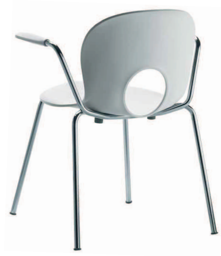
2501. OLIVIA poltroncina impilabile stackable armchair