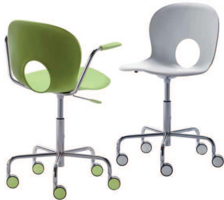
2505. OLIVIA poltroncina su ruote con elevazione a gas swivel armchair with gas lift 2502. OLIVIA sedia su ruote swivel chair