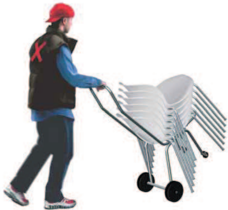
115. carrello di servizio per OLIVIA, ALEXA e EVELINE trolley for OLIVIA, ALEXA and EVELINE

La conexión entresillas, unificada para las colecciones Olivia y Alexa, ha sido estudiada para poder unir entre sí tanto las sillas como los sillones. El carro "pick-up", en acero pintado, es ideal para desplazar rápidamente tanto a Olivia, Alexa como Eveline.